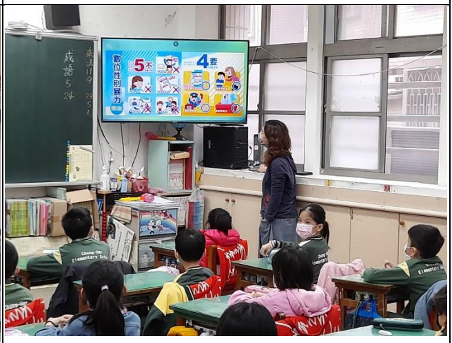
說明：各班導師於早自習進行性別平等宣導。