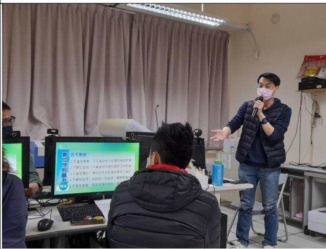
說明：全校教職員工參加性侵防治研習。