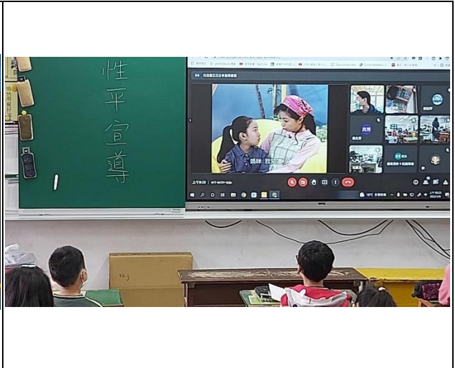
說明：兒童朝會對全校學生進行性侵性騷防治宣導。